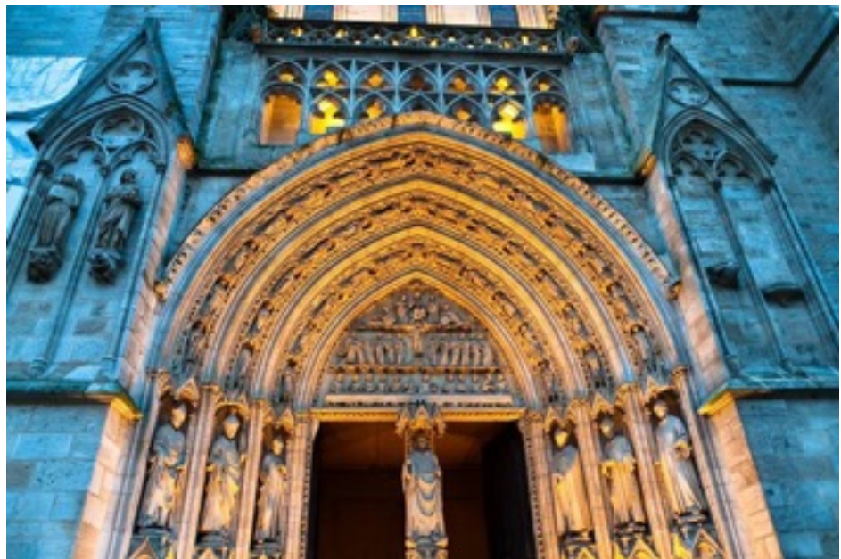
Catedral de San Andrés Burdeos Uno de los proyectos Nártex 2015